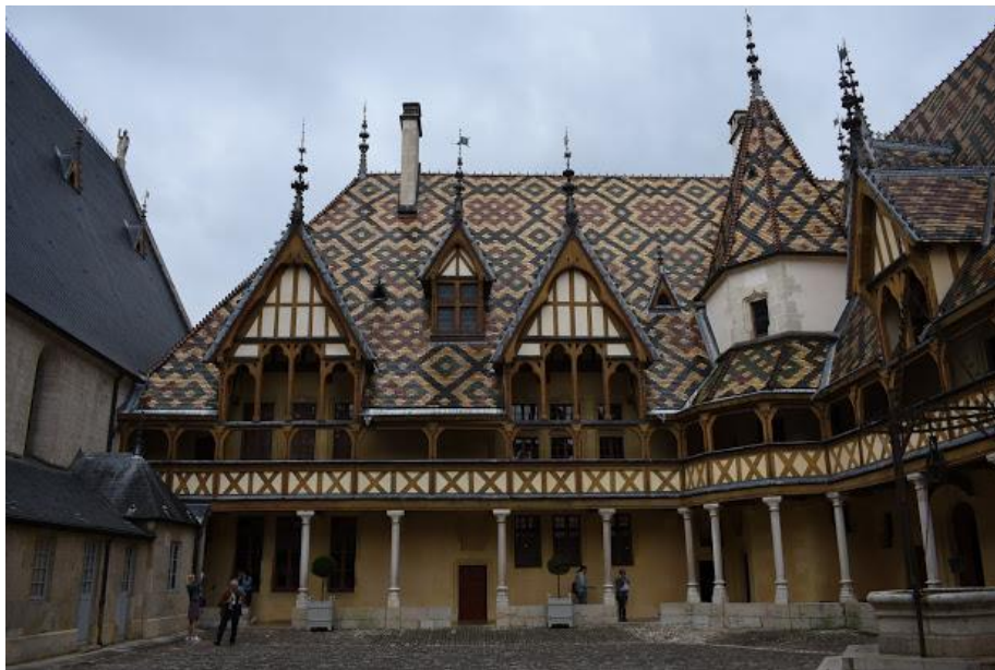
(Ci-dessus : L'Hôtel-Dieu à Beaune, Ci-dessous : la Sainte-Chapelle)