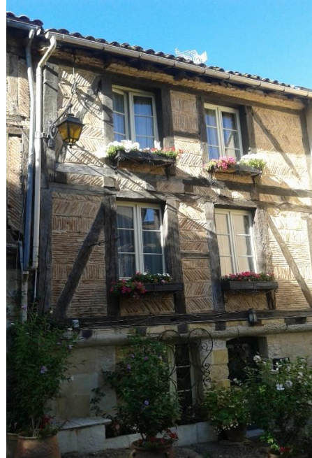
À gauche : la Tour Eiffel À droite : Maison typique de Bergerac