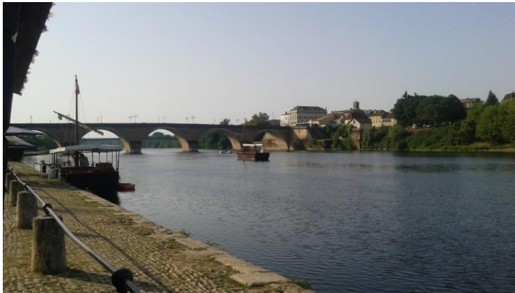
Ci-dessus : Pont de Bergerac, Ci-dessous : Musée du Louvre