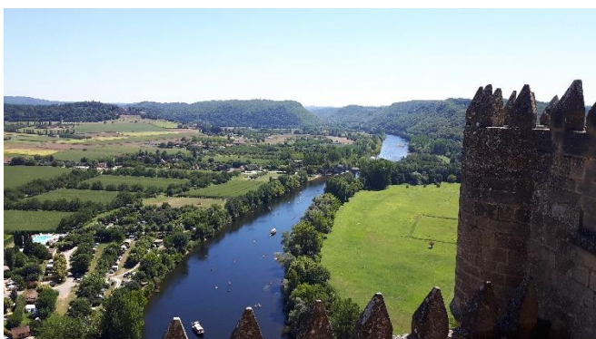
Vue de la Dordogne dans le Château de Beynac français n'ont plus de secrets pour moi!

En ce qui concerne le côté plus touristique de mon voyage, je visitais de nouveaux endroits chaque fin de semaine puisque je ne travaillais pas. Je me déplaçais la plupart du temps en train, car c'était le moyen de transport le moins compliqué et tout de même abordable quand l'on ne va pas trop loin. J'ai ainsi visité une grande partie des alentours de Bergerac comme le château de Beynac, les