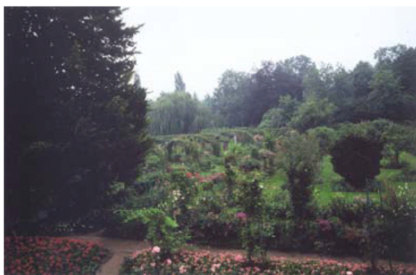
LES TONNELLES DU CLOS NORMAND

Ce jardin à la française, aux voûtes de plantes aériennes entourant d'éblouissants massifs, s'étire devant la maison et les ateliers. Entre les allées bien droites, on retrouve des fleurs aux multiples couleurs, telles que Monet les avait imaginées pour pouvoir peindre aussi bien les jours pluvieux que par beau temps. Les plantes annuelles alternent avec les vivaces de façon à maintenir une floraison constante. Selon la période de l'année, le jardin se pare de couleurs différentes. Il est tout à fait naturel de retrouver le jardin de Giverny dans plus de deux cent cinquante toiles. Les deux passions de l'artiste se trouvent ici réunies. Le jardinier préfigure le peintre. Monet lui-même ne disait-il pas : « En dehors de la peinture et du jardinage, je ne suis bon à rien. » 4