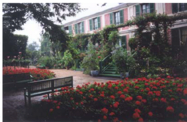
LA MAISON DE GIVERNY

Mais ce qui importe davantage que la maison, ce sont les jardins que les contemporains de Monet considéraient comme l'un de ses chefs-d'œuvre. Comme le disait son grand ami, l'homme politique Georges Clémenceau : « Son jardin était son atelier. »