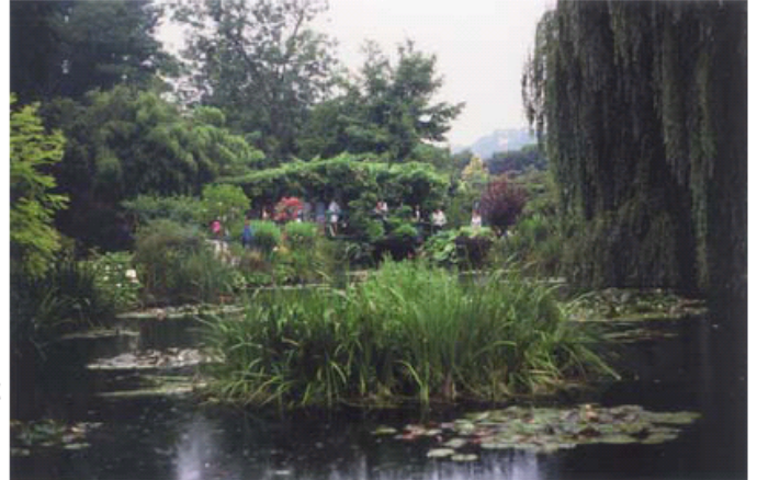
LE PONT JAPONAIS

C'est durant cette période de sa vie qu'il développe son intérêt à suivre les variations d'éclairage d'un même sujet, au long des heures et des saisons. « C'est à Giverny qu'il commence ses fameuses « Séries » qui vont le rendre célèbre. Il exécute la série des vingt-cinq « Meules » entre 1888 et 1891. Il expose chez Durand-Ruel en 1892 une série de vingt-quatre Peupliers; il peint entre 1892 et 1898 la série des cathédrales, la série des « Matinées sur la Seine », puis les Ponts japonais, les Glycines, les Nymphéas où le ciel et les nuages jouent entre les herbes, les fleurs. Tout se reflète sur une surface qui n'est qu'illusion. Et ce sera enfin l'apothéose avec les « Décorations des Nymphéas » où d'un progressif effacement des formes naît « le triomphe de la couleur. » 5