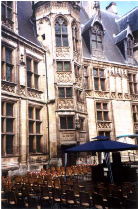
COUR INTÉRIEURE DU PALAIS

Le blason de la famille est partagé également entre les emblèmes de la famille Cœur (cœurs et coquilles) et celui des Macée de Léopart pour sa femme (étoiles à cinq branches).